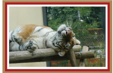
タイガーキングダム(タイ) 虎とたわむれるひとときを