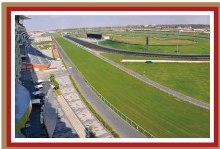
メイダン競馬場(ドバイ) 競馬場ビューのメイダンホテルに宿泊