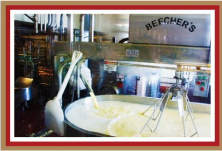
Beecher's(アメリカ)ノチムタク(韓国) 話題の美味しいチーズを堪能して