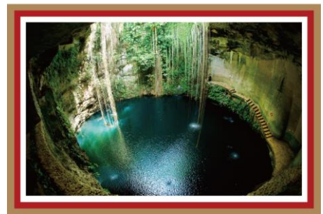
チチェン・イツァ(メキシコ) 蛇の神ククルカンを祀るピラミッドへ