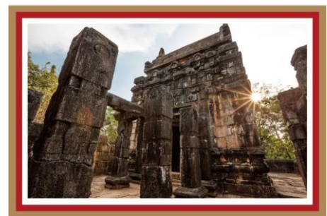
ナーランダー大僧院(インド) 西遊記の猪八戒も目指した天竺へ