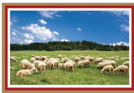
ファーム(ニュージーランド) 羊の国でのんびり田舎暮らし体験