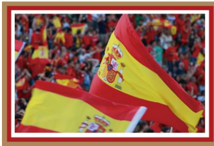
闘牛場(スペイン) スペインの伝統文化に触れてみて