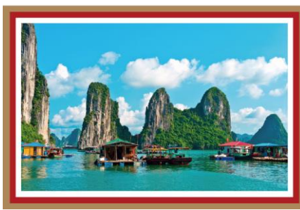
世界遺産ハロン湾(ベトナム) 降龍伝説の地でパワーチャージ