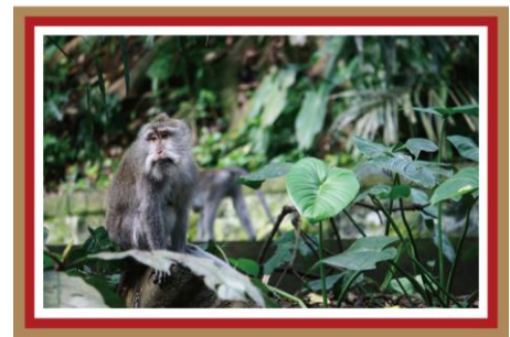
モンキーフォレスト(バリ島) 野生のサルと写真を撮ってみて