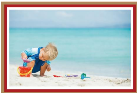
ココス島(グアム) グアム固有の鳥ココバードが住む島