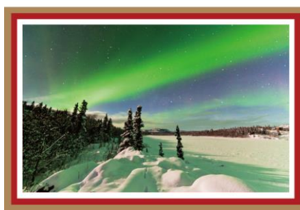
イエローナイフ(カナダ) 犬ぞりでオーロラ地点までお見送り