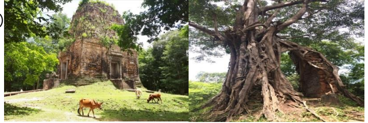
▲カンボジア第3の世界遺産「サンボークレイクック」